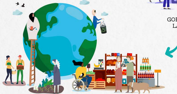
PRINCIPIOS XERAIS PARA SOLUCIÓNS (POLÍTICAS)